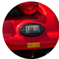
3. 작업기 승하강 스위치