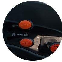
1. 부분속/ 초저속/4WD레버