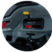
2. 후방 작업기 조절 레버