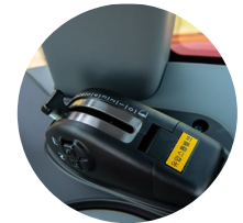
5. 전자 리프트 컨트롤