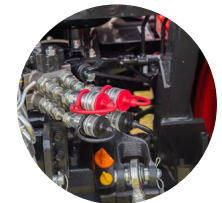
6. 후방 외부 유압 밸브