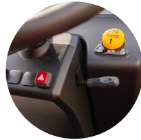
1. 틸트 핸들

48마력에 4기통 엔진의 강력한 힘에 저상형 타이어를 장착한 하우스 트랙터