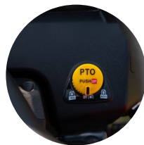
3. PTO 스위치