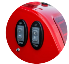
5. 작업기 상하강 스위치