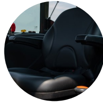
1. 팔걸이형 고급시트