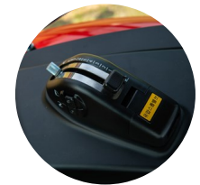
6. 전자 리프트 컨트롤