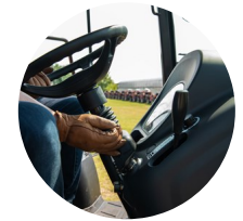
4. 틸트 핸들