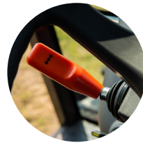
2. 파워 셔틀