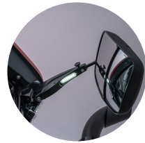
2. LED 듀얼 사이드 미러