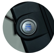
3. 엔진 스타트 버튼