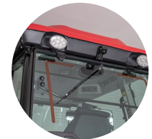
6. 후방 열선 유리