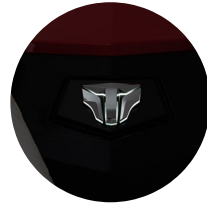
1. LED 엠블럼

세련된 디자인, 강력한 퍼포먼스 그리고 프리미엄 편의 사양을 겸비한 TYM의 플래그십 모델