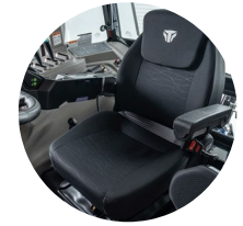
4. 에어 서스펜션 회전 시트