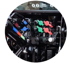
5. 후방 외부 유압 포트 (유압식 톱링크)