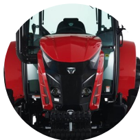
1. 타이거 페이스 후드 디자인

2023년, 꾸준히 축적해온 기술과 디자인으로 TYM 만의 과학 기술 농업을 향한 철학을 선보입니다.