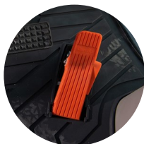
3. 전자 오르간 페달