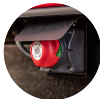
2. 배터리 차단 스위치