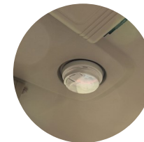
4. LED 실내등