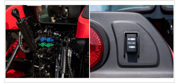
6포트 후방 외부 유압 밸브 및 유압식 톱링크(고급형)

운전자 좌측에 스마트폰 무선 충전기, 냉온 컵 홀더 등 프리미엄 편의 사양들을 적용하였습니다. 장시간 작업에도 편안함을 제공하여 탑승 첫 순간부터 마지막까지 즐거움을 선사합니다.