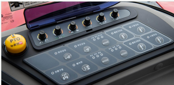
BOSCH 전자식 유압 제어 시스템(고급형)

유압식 톱링크 2포트를 별도 구성하여, 외부 유압 6포트 온전히 활용 가능하여 다양한 작업기를 부착할 수 있습니다. 또한 외부에서 유압식 톱링크 스위치로 쉽게 작업기를 부착할 수 있습니다.