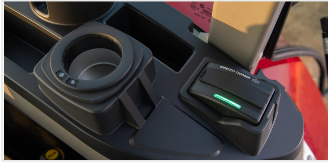
스마트폰 무선충전기 및 냉온 컵 홀더(고급형)

정밀한 독일 엔지니어링에 기반한 도이츠 엔진은 중저속 RPM에도 고출력, 고토르크를 자랑합니다. 또한 고장이 적고 수명주기가 길어서 생산성이 뛰어납니다.