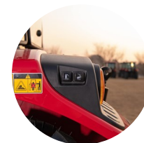
6. 외부 히치 제어 스위치(좌우 적용)